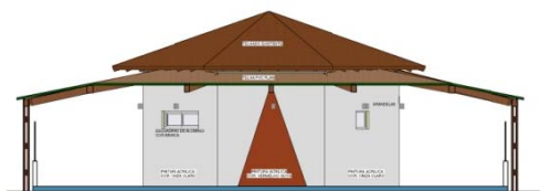
⑤ FACHADA D ESCALA - 1 : 50