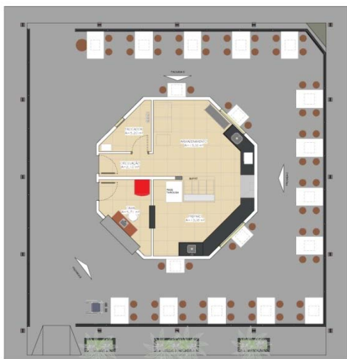
① Layout ESCALA - 1 : 50