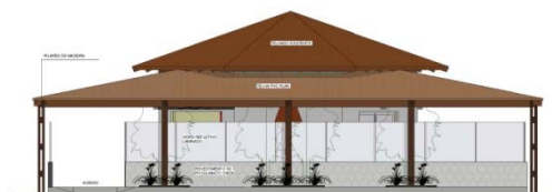
② FACHADA A ESCALA - 1 : 50