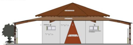
④ FACHADA C ESCALA - 1 : 50